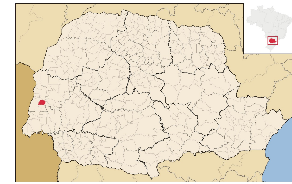
PLANTA DE SITUAÇÃO SÃO JOSÉ DAS PALMEIRAS-PR S/ESCALA