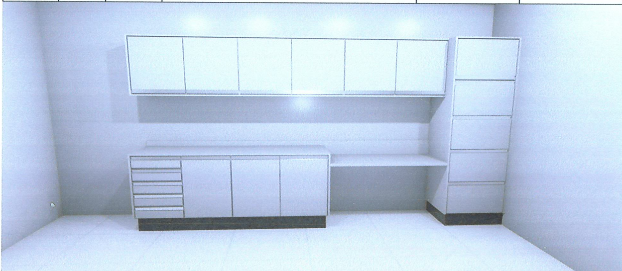
IMAGEM ILUSTRATIVA 08.281.309/0001-09