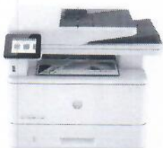
Impressora HP LaserJet Pro MFP 4103dw

Esta impressora foi desenvolvida para proporcionar o máximo de produtividade com velocidades rápidas e hardware confiável, oferecendo uma utilização diária sem complicações onde quer que o trabalho aconteça, para que você possa se concentrar mais no seu negócio.