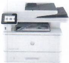
Impressora HP LaserJet Pro MFP 4103fdw