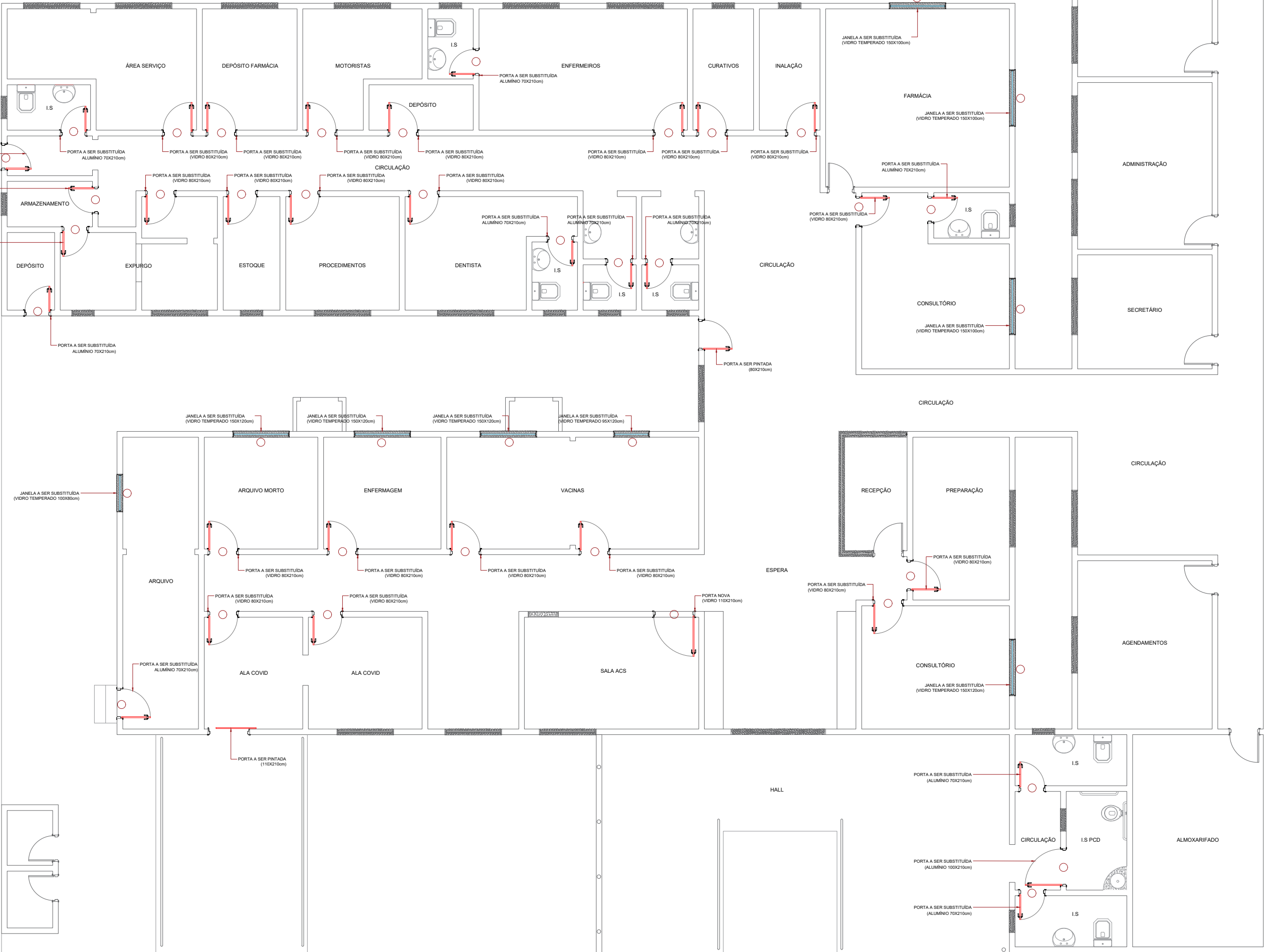
PORTAS E JANELAS ESC: 1:100