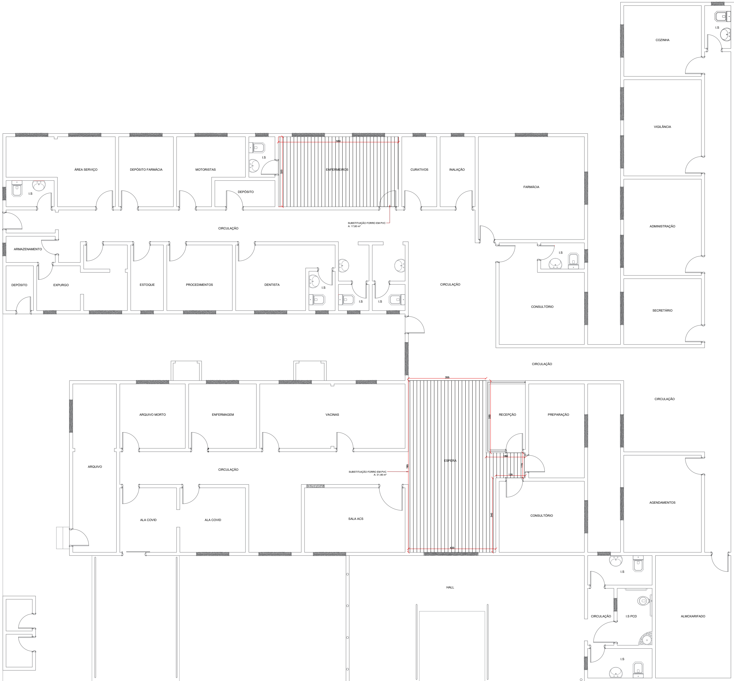
PLANTA DE TROCA DE FORRO EM PVC ESC: 1:100