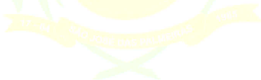
NELTON BRUM PREFEITO MUNICIPAL