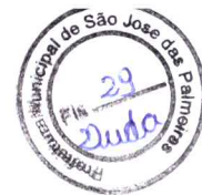
NELTON BRUM PREFEITO MUNICIPAL