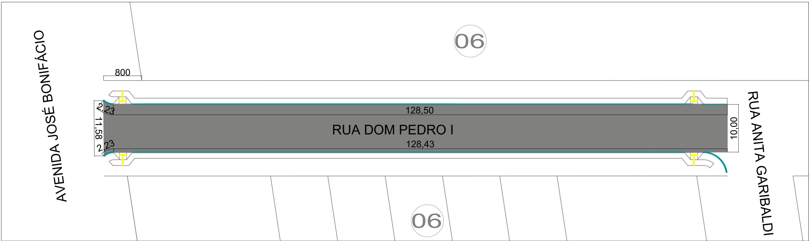
RUA DOM PEDRO I ESCALA: 1/75