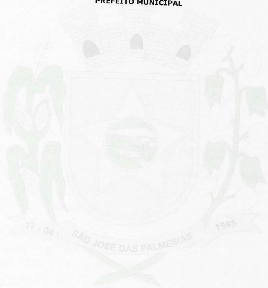
NELTON BRUM PREFEITO MUNICIPAL

Este documento contém o mesmo teor do original assinado