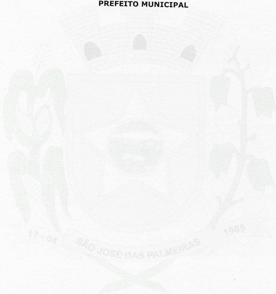
NELTON BRUM PREFEITO MUNICIPAL

Este documento contém o mesmo teor do original assinado