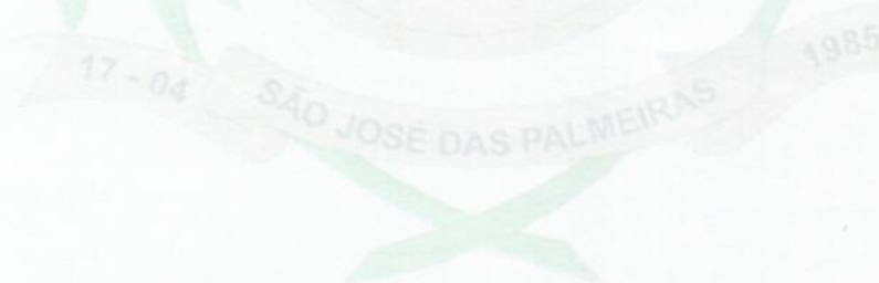
NELTON BRUM PREFEITO MUNICIPAL