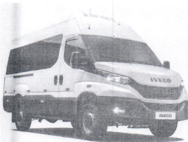
DAILY VETRATO 45-170

Foto ilustrativa veículo Daily Passageiro